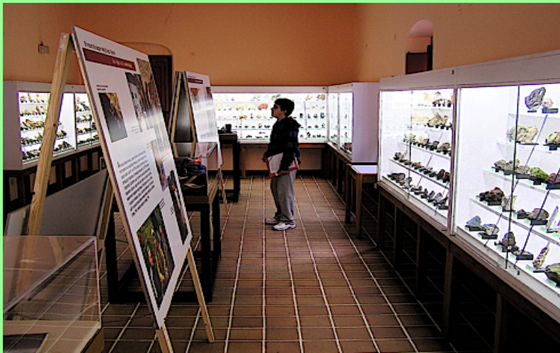
Un dels espais més singulars del Museu Mollfulleda de Mineralogia és la col·lecció de