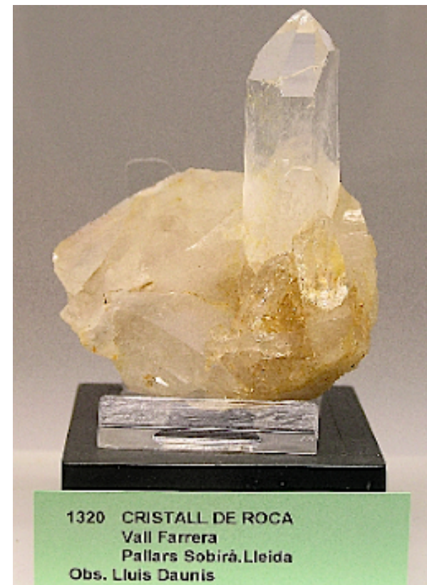
1320 CRISTALL DE ROCA Vall Ferrera Pallars Sobirà, Lleida Obs. Lluís Daunis

En aquesta sala del Museu, podeu contemplar peces de gairebé tots els jaciments de Catalunya des dels més antics fins a les darreres troballes, on destaquen les importants mines de Gavà i Cardona.